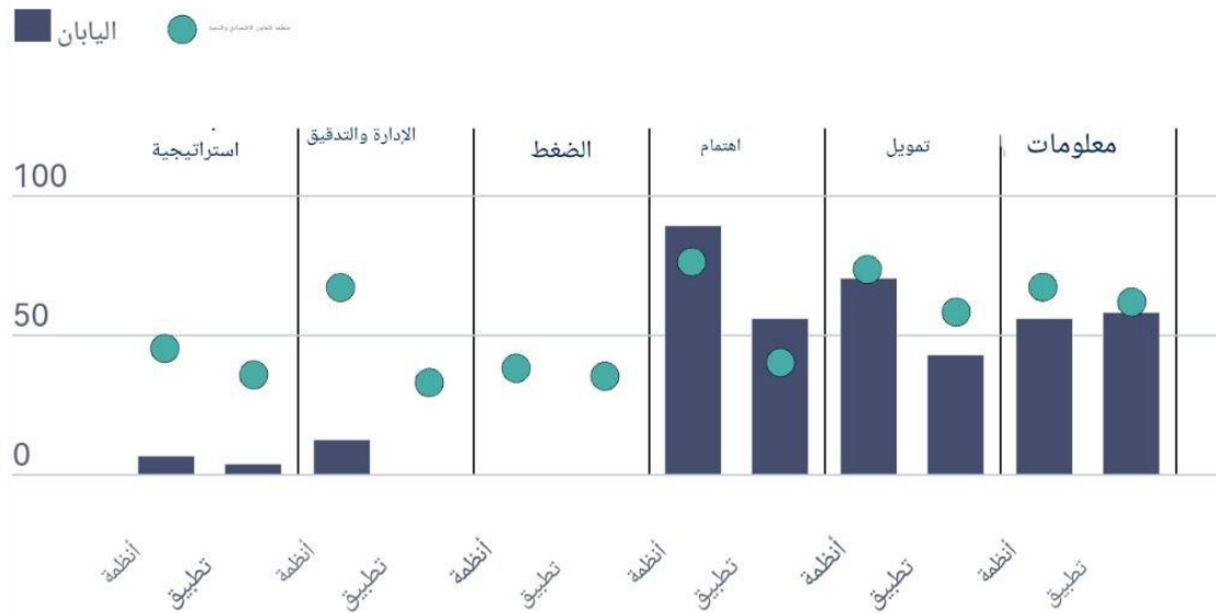
الشكل من إعداد الباحث بالإستناد على:

Economic Cooperation Organization, Anti Corruption and Integrity Outlook 2024 – Country Notes: Japan, OECD website, 26 March 2024, Quoted from the world wide web(internet) Available at the following link: https://www.oecd.org/en/publications/anti-corruption-and-integrity-outlook-2024-country-notes_684a5510-en/japan_d33d6aac-en.html Site was visited: February 19, 2025.